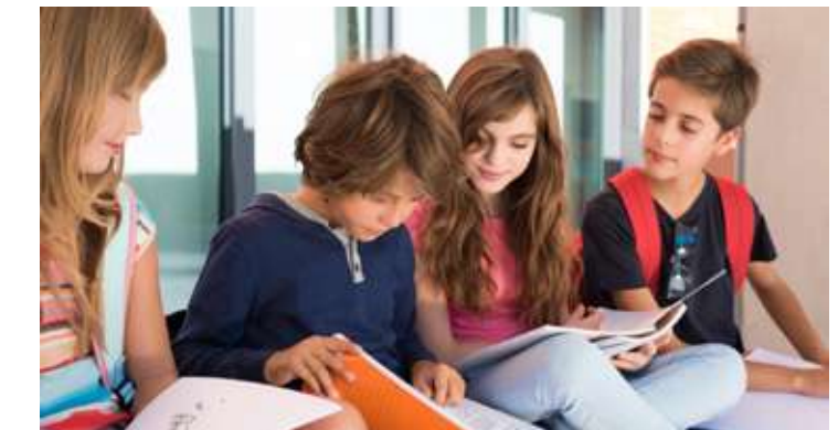
L'école primaire André Malraux est à 5 minutes* à pied, les collèges et lycées dans un rayon de 500 mètres.*