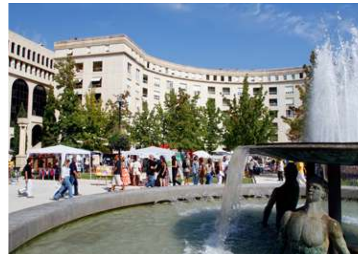
À moins de 10 minutes* à pied, le quartier Antigone signé Ricardo Bofill avec ses terrasses de café et ses nombreuses animations.