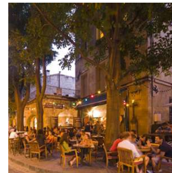
Ambiance détente sur l'une des nombreuses terrasses du centre-ville

A ce dynamisme florissant s'ajoute une qualité de vie remarquable propre aux villes du sud avec 300 jours de soleil par an*, les plages accessibles en voiture, en bus ou en tramway. Plus de 100 kilomètres* de littoral sont aménagés de ports, d'étangs et des milliers d'hectares d'espaces naturels sont accessibles rapidement tels que le massif de la Gardiole, le Pic Saint Loup, les gorges de l'Hérault, le Lac du Salagou ou la petite Camargue.