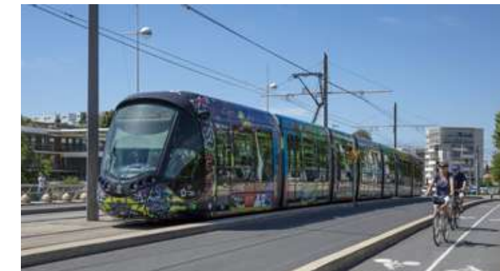
Le tramway ligne 1 à 500 mètres* relie le centre commercial Odyseum, le cœur historique et les facultés.