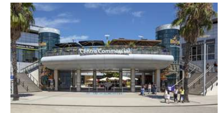
L'Odyseum à 2 stations de tramway, avec son centre commercial, ses restaurants, son cinéma et ses loisirs (patinoire, mur d'escalade, planétarium...)