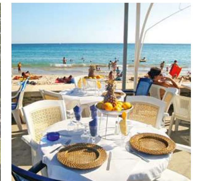
Les plages de la Méditerranée à 15 minutes* en voiture