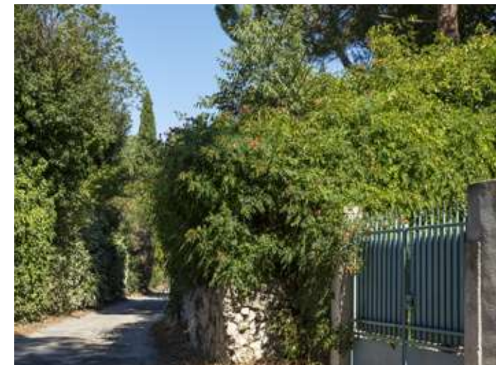
Les ruelles arborées pavillonnaires du quartier de la Lironde, un esprit de campagne règne en ville.