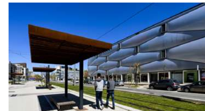
Port Marianne et ses nombreuses enseignes séduisent les amateurs de bien-être et de design.