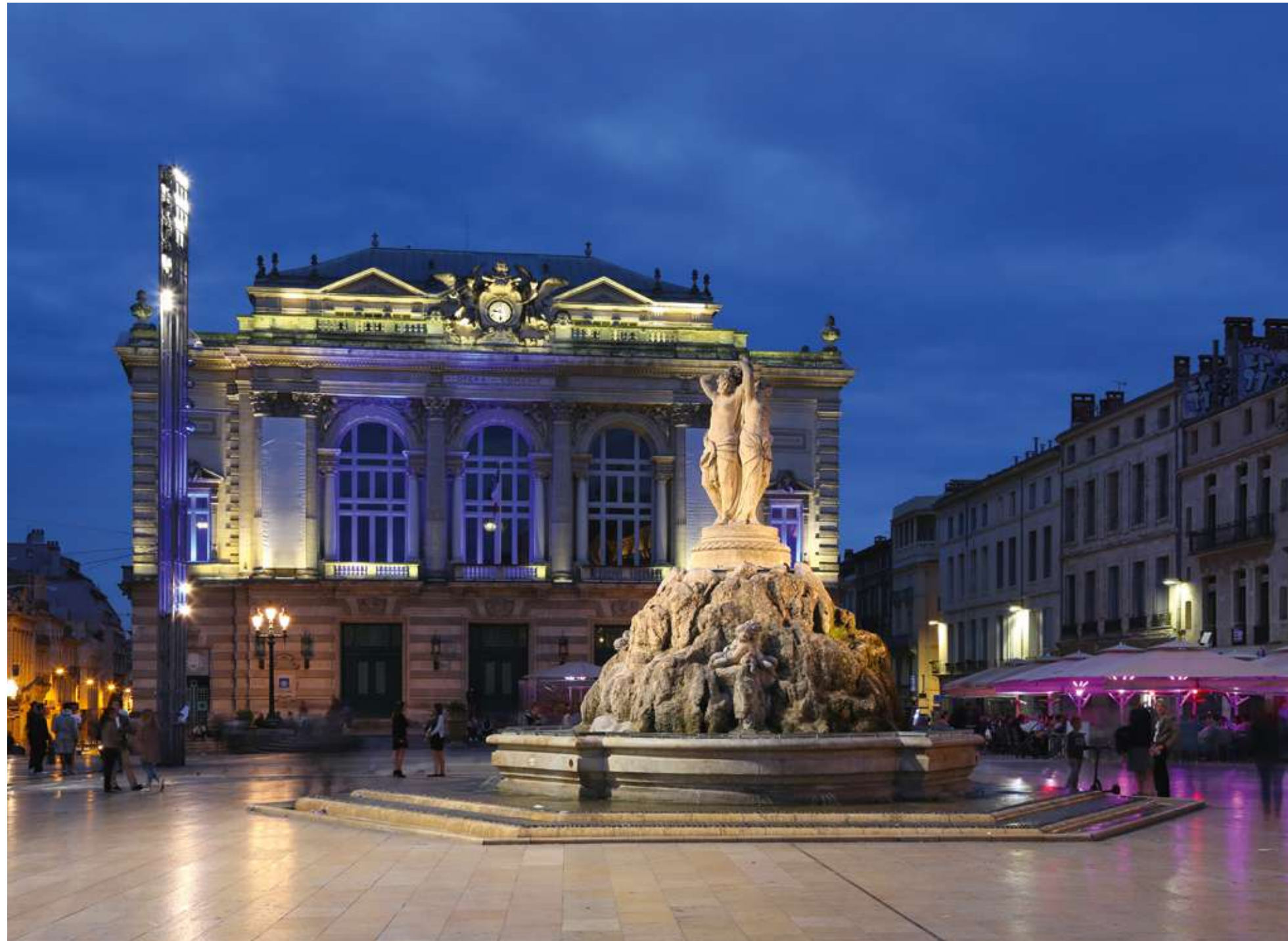
Place de la Comédie, l'un des plus vastes espaces piétonniers d'Europe, encadrée par l'Opéra et la fontaine des Trois Grâces.

Plus de 1 000 ans ont façonné la Ville et il n'a fallu que quelques décennies pour la hisser aux tout-premiers rangs des métropoles les plus attractives de l'hexagone.