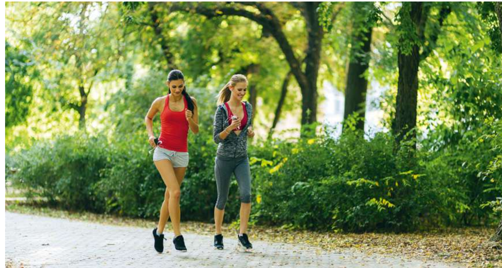
Les 7 hectares du Parc de la Lironde à 5 minutes* à pied du Domaine d'Antonin.