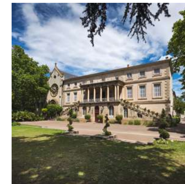
Le domaine de Grammont avec son château, son centre équestre et le Zénith à 10 minutes* en voiture